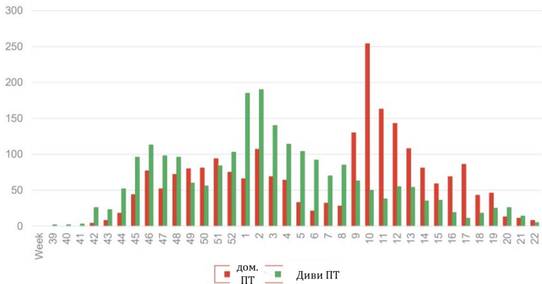
Графика 1: констатирани огнища и случаи на ВПИП по седмици

Информация за разпространението на ВПИП в световен мащаб е илюстрирана на карта 1: