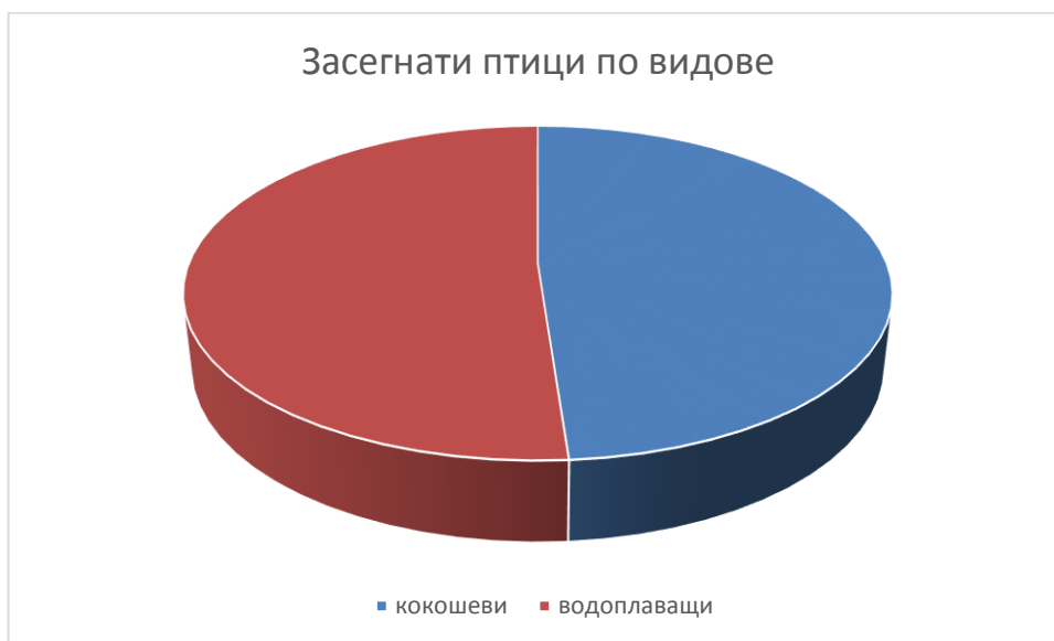
Графика 1: Засегнати домашни птици по видове

За периода от 03-10.06. 2022 г. са обявени 12 огнища на заболяването ИП при домашни птици. Заболяването е констатирано в 7 ферми във Франция като вторично. В Унгария са засегнати 2 ферми за водоплаващи птици. Едно от констатираните огнища е в Хърватска в лично стопанство със 17 птици. Общо са засегнати 116 544 броя птици . Констатираният щам е H5N1 . Засегнати са 56 508 бр. кокошеви птици и 59636 броя водоплаващи птици. Информацията е илюстрирана на графика 1: